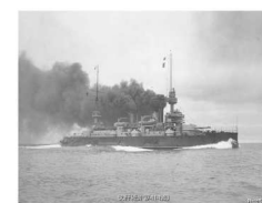
Le Suffren 27/11/1903