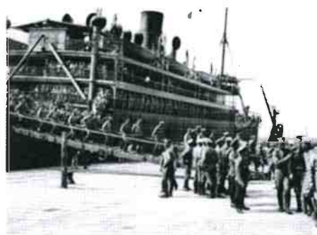
Brest, 17 juillet 1916. Navire de transport de troupes Venezuela . Débarquement des soldats du 3e régiment d'infanterie, appartenant à la 2e brigade spéciale en provenance d'Arkhangelsk.