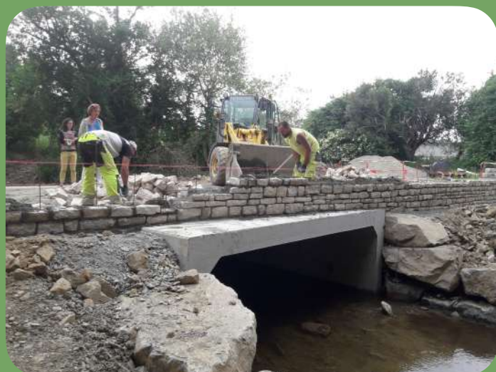
Finalisation et réalisation du muret en pierre