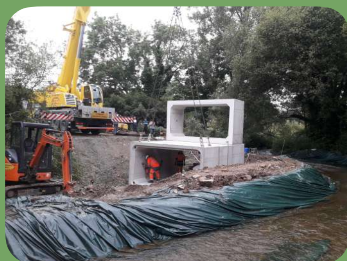
Début du chantier