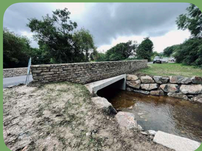
Fin du chantier