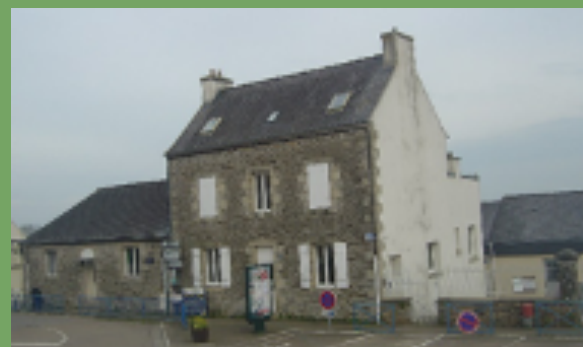
En 1873, construction de la mairie de l'école des garçons.

Monsieur Bernard, recteur de l'époque, voulait empêcher la construction de l'école mais, le terrain du presbytère étant une propriété communale, il y fut contraint.