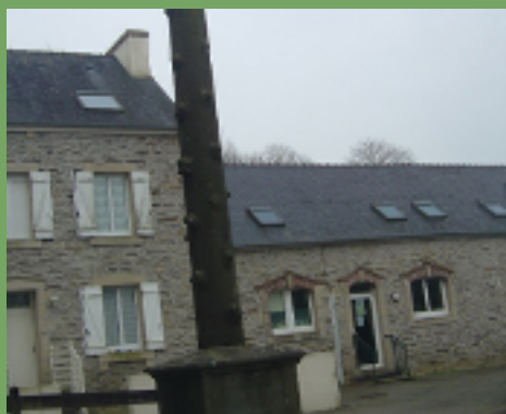
Ancienne école des filles.

L'école des filles ouvre en 1872, soit un an avant celle des garçons. C'est Vincent Fournis, maire de Garlan à cette époque, qui fait donation d'un terrain de 8