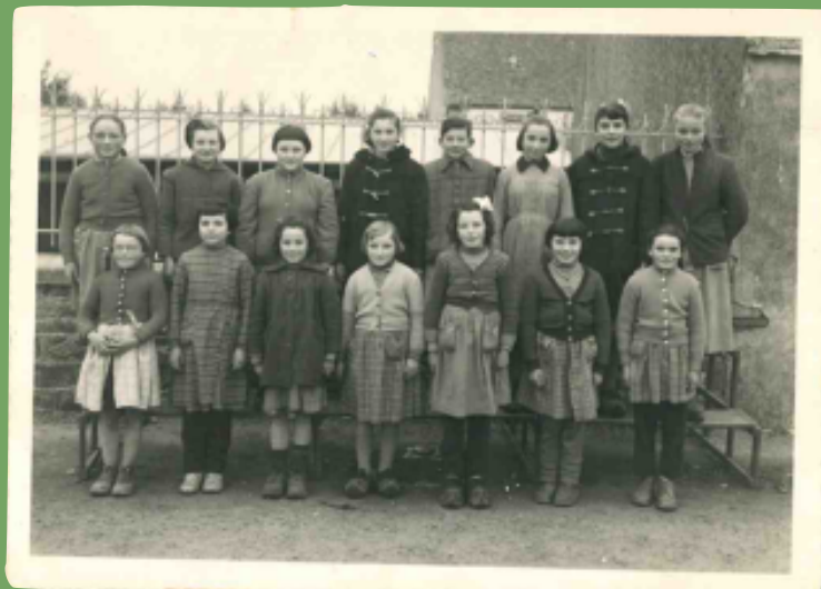
Photo de classe année 1957