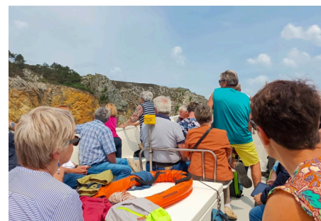
À la découverte des grottes marines de Morgat.

Le 17 juin dernier, le Comité des fêtes a organisé une belle sortie découverte. Direction Térénez et les grottes marines de Morgat pour les 37 participants qui sont revenus ravis.