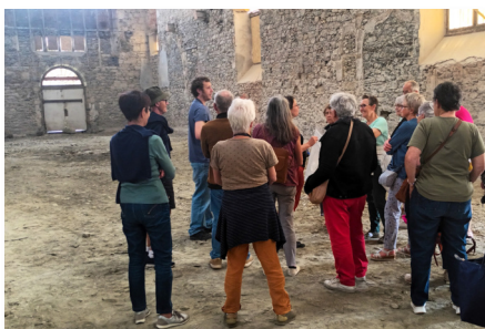
Visite des travaux du Musée des Jacobins.

Diverses sorties culturelles et de découvertes ont été proposées cette année, pour le plaisir des participants.