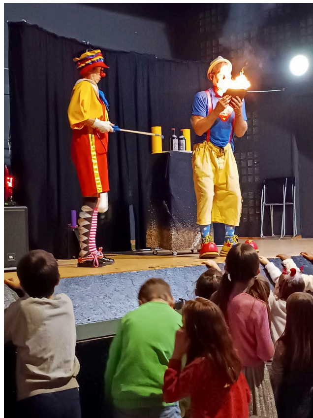
Les clowns magiciens de la troupe Organitou.

Soirée Crêpes, le 1 er mars / Théâtre des enfants, le 29 mars. Salle Ti Gwer.