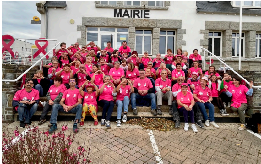
Les bénévoles de cette édition.

Une somme qui permettra d'aider à la recherche médicale pour lutter contre