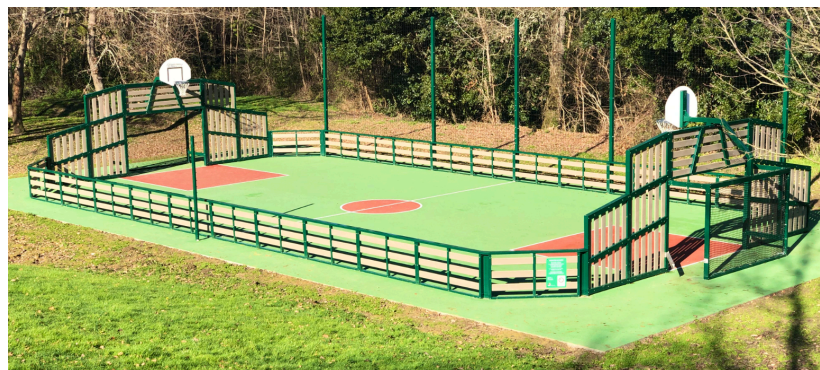
Exemple d'un City park. À Garlan, la dimension retenue serait de 12 mètres de large sur 24 mètres de long.