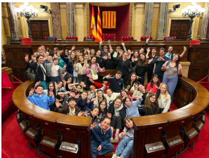
Les jeunes du CMJ à l'intérieur du Parlamento de Catalunya .

Après quatre jours intenses, ce projet intercommunal se conclut par une expérience riche en découvertes, en rencontres et en engagement.